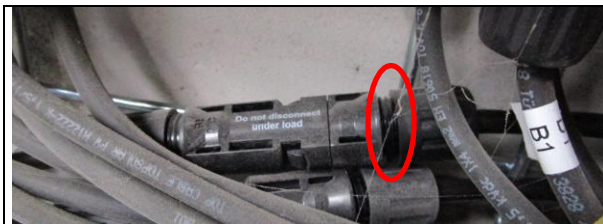
Bevestiging connector niet volledig aangedraaid.