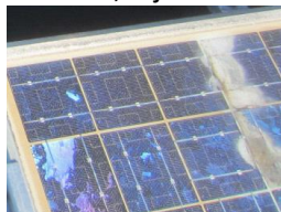
Paneel is 15 jaar oud en vertoont zichtbare gebreken.