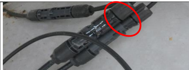
Connector volledig aangedraaid.